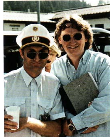
Seite an Seite mit dem "King of Blödel" – Otto Waalkes

Mystische Stimmung in Malibu Beach, der Künstler-Kolonie von Hollywood, wo Eduard Ehrlich und Rudi Frenner Zukunftspläne schmieden